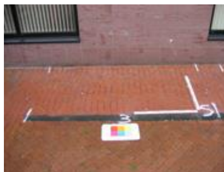
5 седмици след обработка